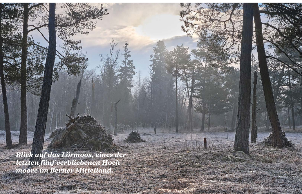
Blick auf das Lörmoos, eines der letzten fünf verbliebenen Hochmoore im Berner Mittelland.