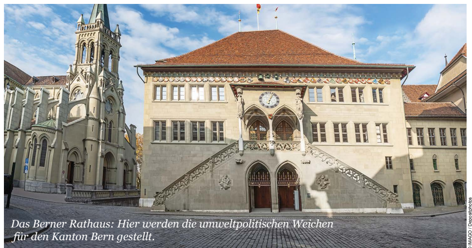
Das Berner Rathaus: Hier werden die umweltpolitischen Weichen für den Kanton Bern gestellt.

Während die Mitte weiterhin ungefähr die umweltpolitische Mitte abbildet, ist die FDP die grosse Absteigerin. Deren