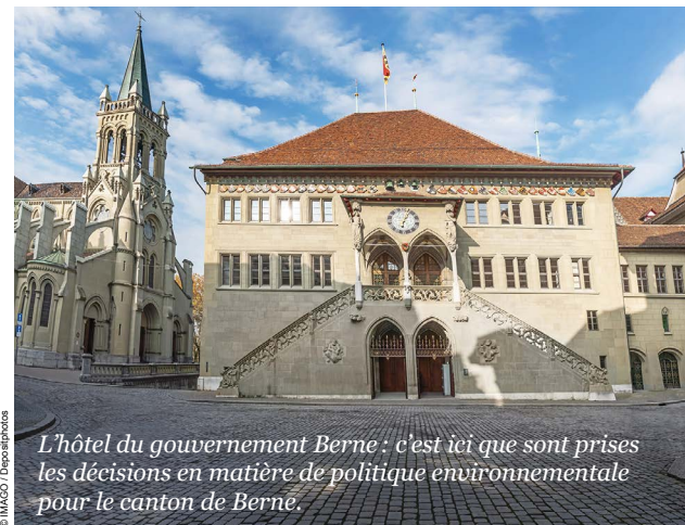
L'hôtel du gouvernement Berne : c'est ici que sont prises les décisions en matière de politique environnementale pour le canton de Berne.

En mars, le canton de Berne élira non seulement son parlement, mais aussi son gouvernement. Afin de mettre en