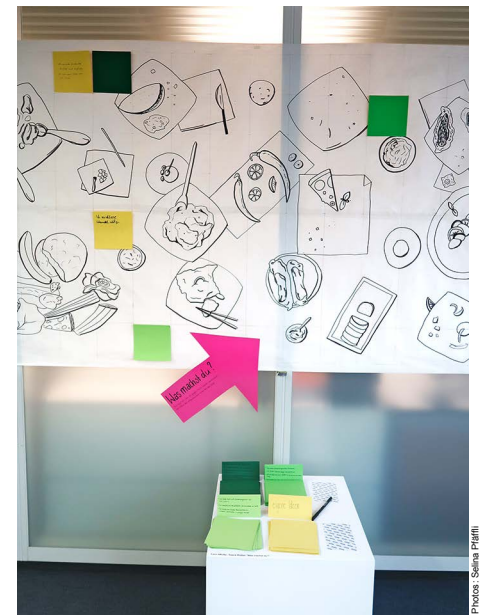
Moins de gaspillage alimentaire : quelles idées as-tu ?