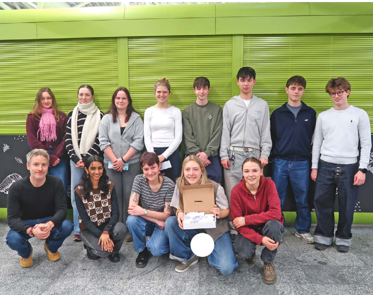
Classe N23d (à l'arrière), enseignant (à gauche) et WWF Youth Berne (à l'avant)

Une affiche géante est accrochée au mur, des objets sont disposés sur des socles et de petites tables. Par leurs couleurs, leurs matériaux et leurs formes, ils racontent notre quotidien. Ils parlent des choses que nous utilisons, remplaçons, jetons.