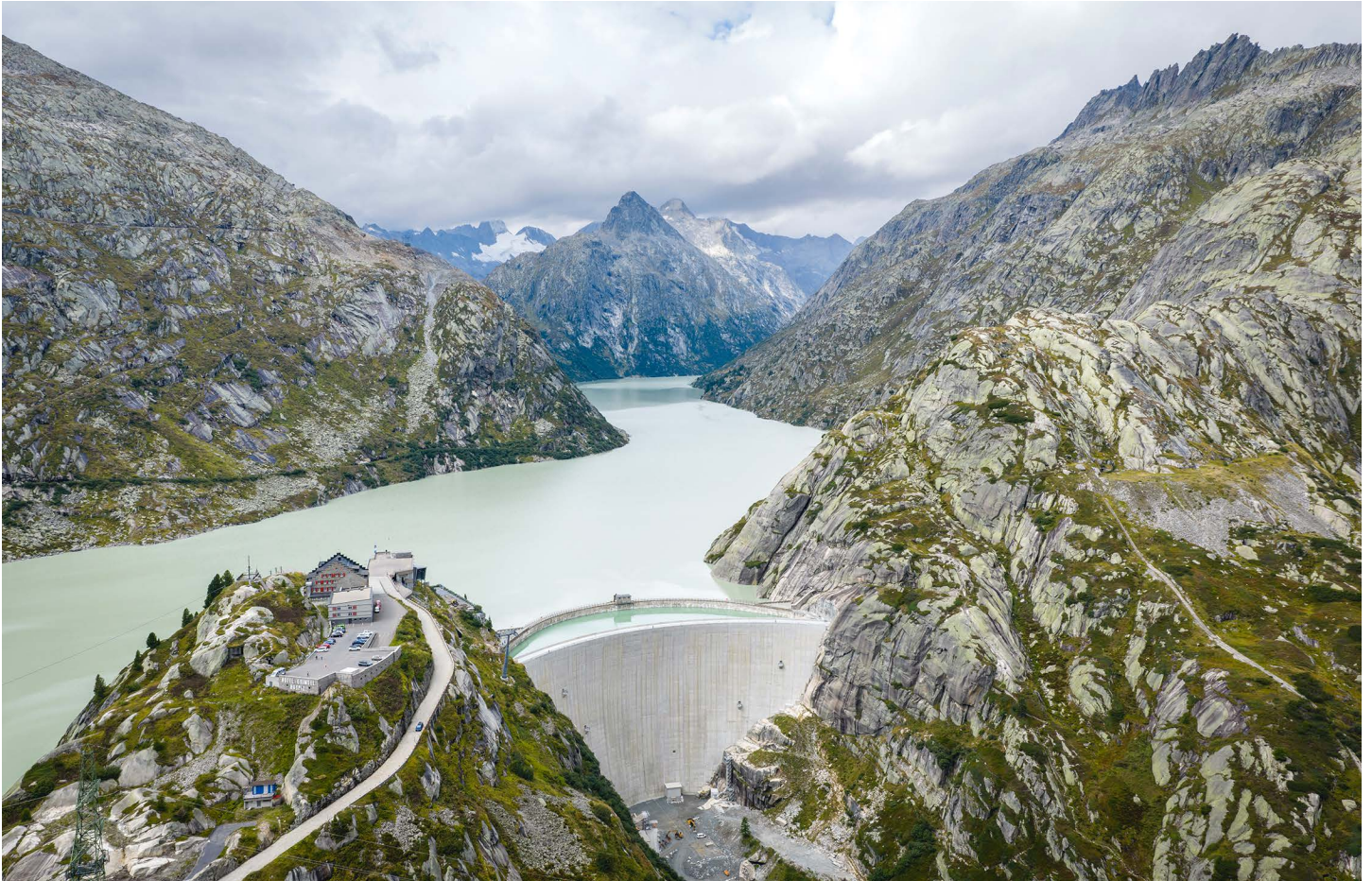
Afin d'augmenter la production d'électricité en hiver, le niveau du lac du Grimsel doit être relevé de 23 mètres.

Numéro 2/2026, WWF Berne, Bollwerk 35, 3011 Berne, tél. 031 312 15 79 info@wwf-be.ch, www.wwf-be.ch, compte de dons : CP 30-1623-7