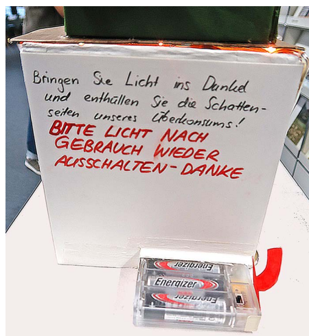
Lumière allumée : telles sont les conséquences pour l'environnement.

WWF Youth est un mouvement de jeunesse du WWF actif dans toute la Suisse. Il a été créé pour donner aux jeunes les moyens de vivre et d'agir de manière durable. Une formation de base en lea-